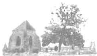
Petite Chapelle de Gisy-les-Nobles